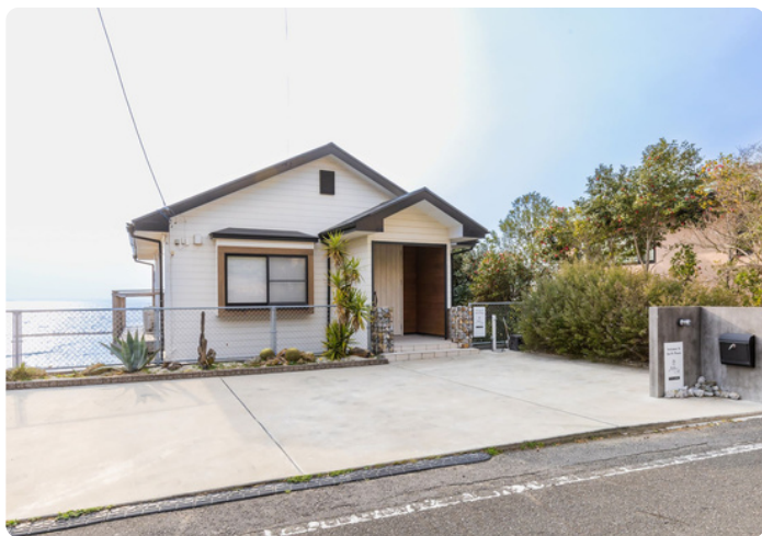
建物目の前が駐車スペースです

当施設はキーBOXで鍵の受け渡しを行っております。 キーBOXの解錠番号は、チェックイン当日の朝8時頃にご予約時に伺ったメールアドレスへご案内いたします。 フィルタ設定・迷惑メールのご確認をお願いいたします。