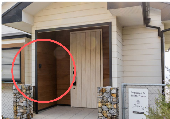
キーBOXは玄関ドアの横についています